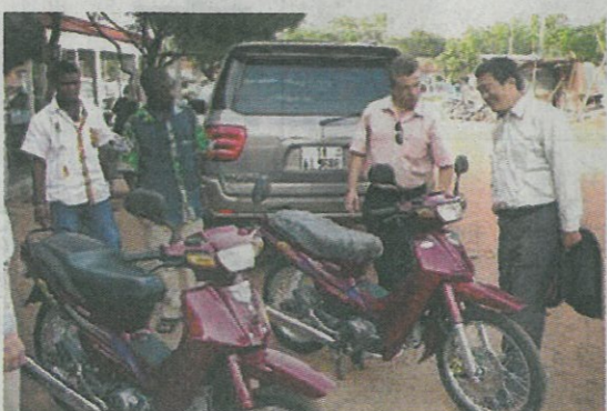
手厚いサポート体制でアフリカなど新興国の地盤を固める

ウガンダで行脚... アフリカ中東部の国ウ... ガンダ。ヴィクトリア湖... を望む場所にヤマ発の船... 外機の営業担当者が足し... げく通い詰めてきた漁村... がある。地元の漁師たち... を集め、教え込んできた... のは魚の捕り方や保存方... 法など。日本の漁師から... 次の成長市場を見据え、... 新興国開拓を進める。